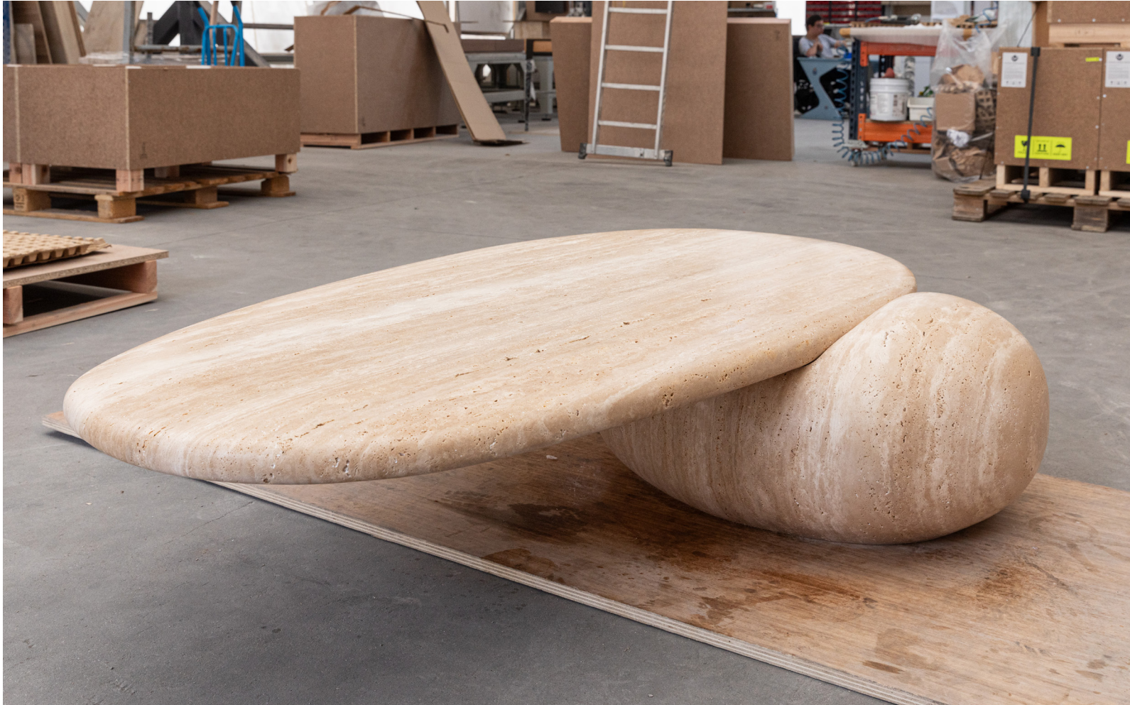
Table Basse KARN

Utilisés comme signalétique sur les pistes de randonnées en montagnes, les amas de pierres appelés cairn (issu du celtique Karn) permettent aux randonneurs de se repérer dans leur itinéraire et de communiquer différentes informations entre eux.